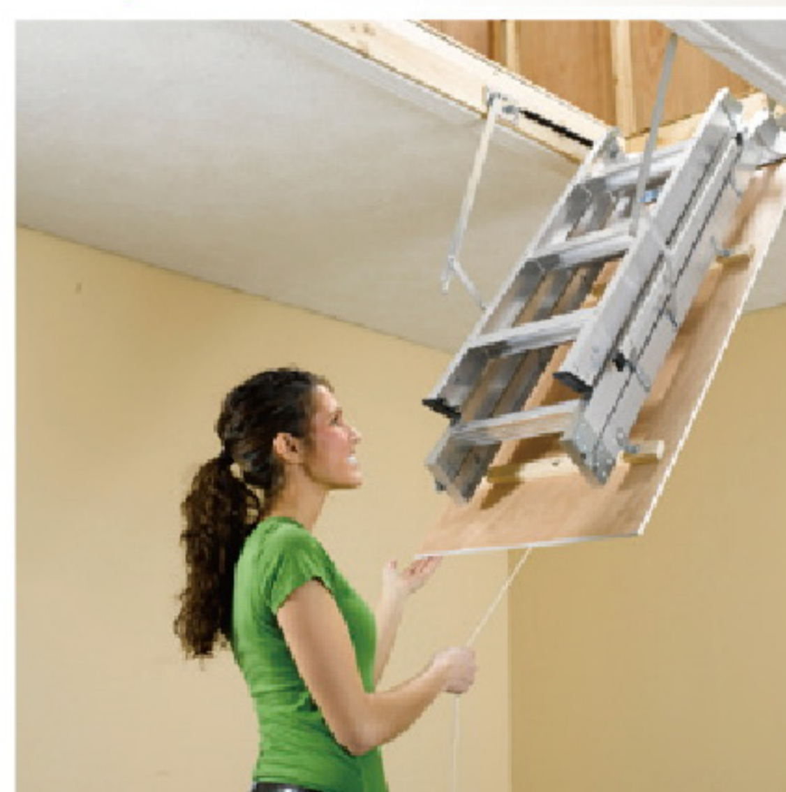
收攏放好後，看不到梯子 美觀大方