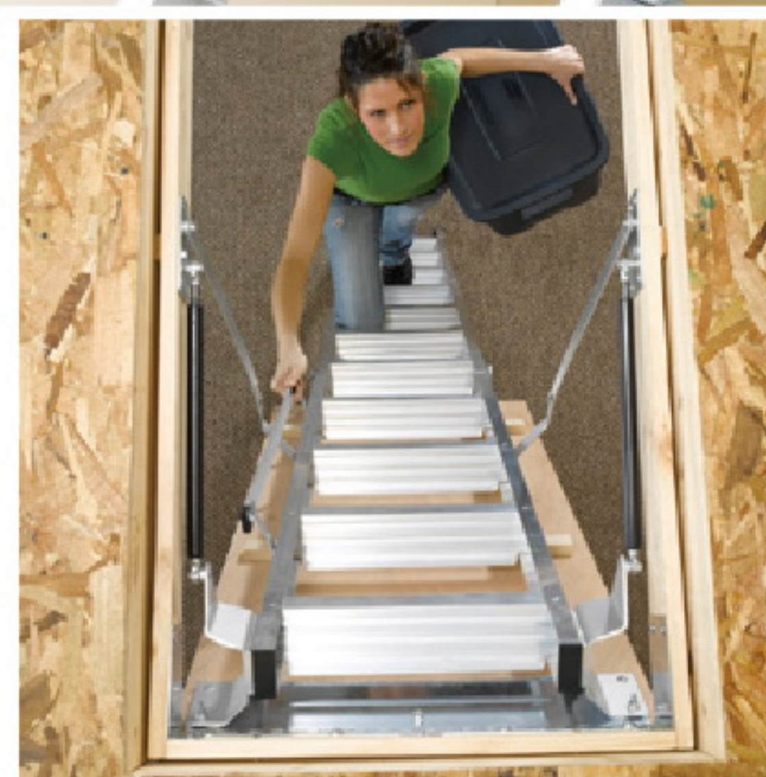
使用時，拉開伸直即可 操作方便輕鬆