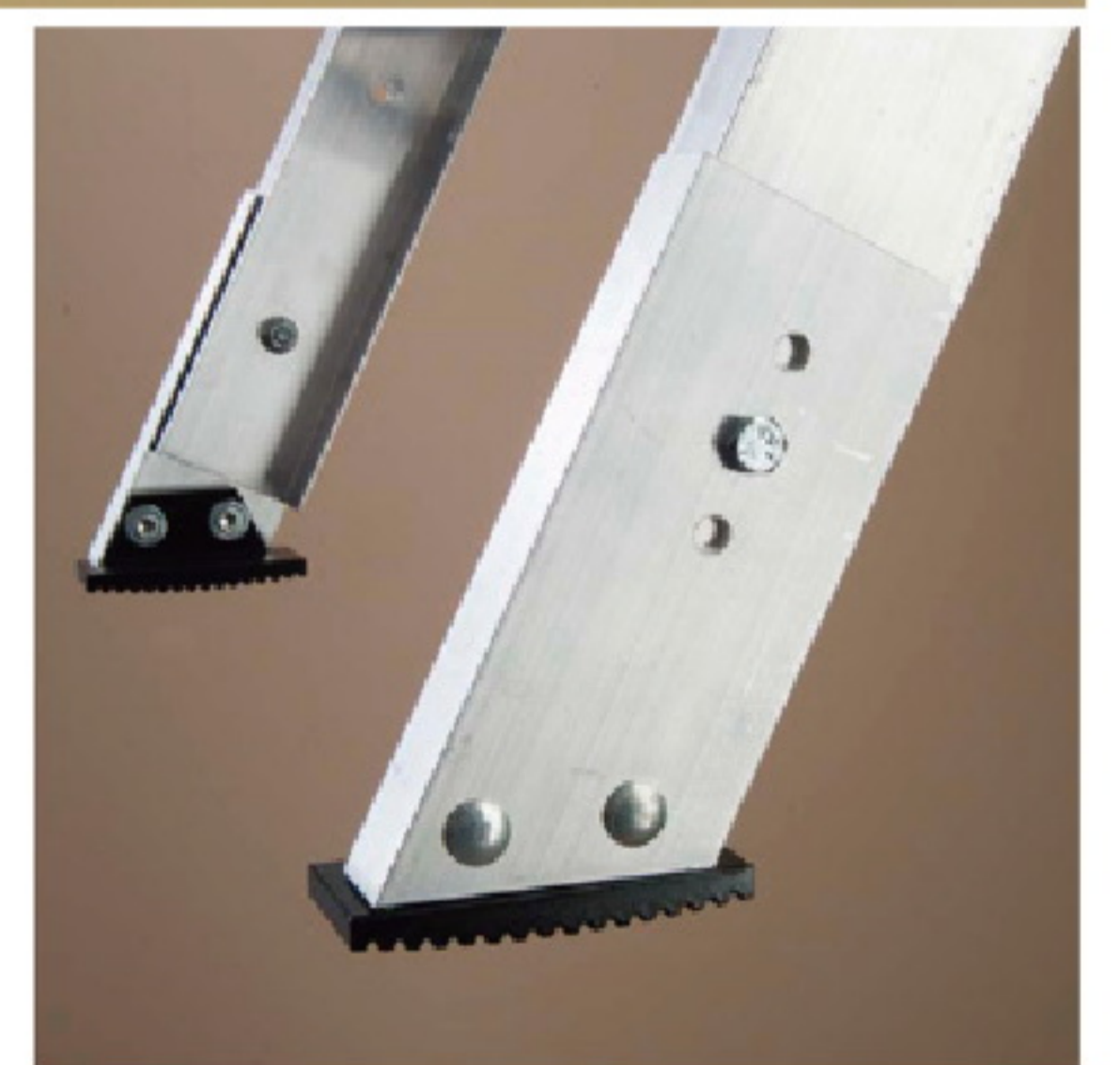
可根據現場情況做微調 梯腳可調節